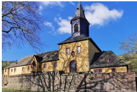
Veranstaltungsort Altes Kapuzinerkloster

Jeden Montag ist unsere Café-Ecke von 15.30 Uhr bis 17.30 Uhr geöffnet. Jeder ist willkommen. Während der Buchausleihe in unserer Katholischen öffentlichen Bücherei (KÖB) können Groß und Klein bei einem Getränk und gutem Kuchen verweilen. Im Winter treffen wir uns im Pfarrsaal, während in den Sommermonaten der Innenhof der Klosteranlage dazu einlädt, einen gemütlichen Nachmittag zu verbringen. Für die Kinder gibt es am Ende des Monats ein Erzähltheater, das in unseren Jugendräumen stattfindet. Hier können die Kinder anschließend mit dem neuerworbenen Spielmaterial gut zusammen ins Spiel finden.